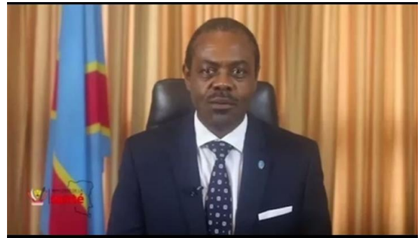
保健大臣による「エボラ出血熱」発生の発表

コンゴ保健省と世界保健機関（WHO）の疫学チームは、ウイルスに接触した人の追跡調査と経過観察を続けている。ただ、調査は一筋縄ではいかない。感染地の人びとは仕事や家庭の事情で移動が多く、村から村へと渡り歩いている。そのため医療機関もいろいろな場所で受診する。エボラの疑い例と分かり治療センターに搬送されるまでに、2ヵ所以上の診療所を受診していることが多い。流行の始まり以来、特定された接触者は8000人余り。現在2700人以上が保健省による経過観察を受けている。