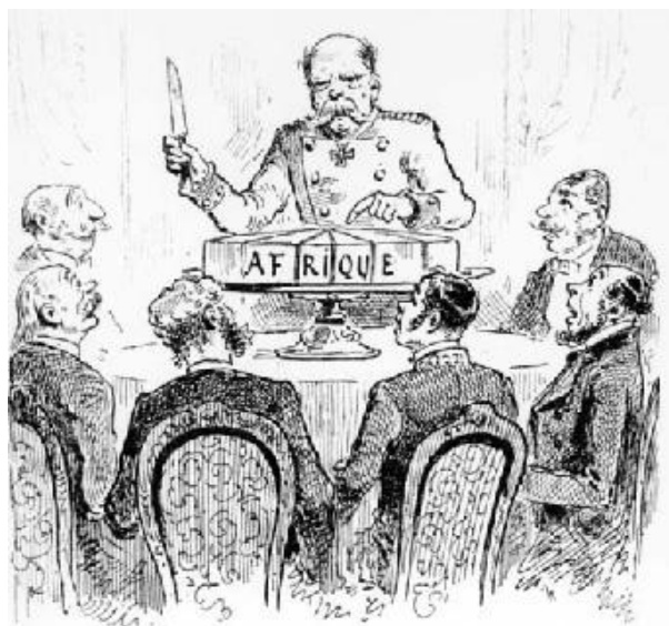
アフリカ分割の風刺画

す。それはまず植民地、コロニズムということです。でもその植民地の前には 奴隷売買がありました。コンゴの現在の社会的、経済的また政治的な形を作ったのは ベルギーからです。しかし、歴史的にはベルギーだけではありません。植民地はベルギーからでしたけれども、ベルギー、フランス、ドイツとアメリカも関係があります。