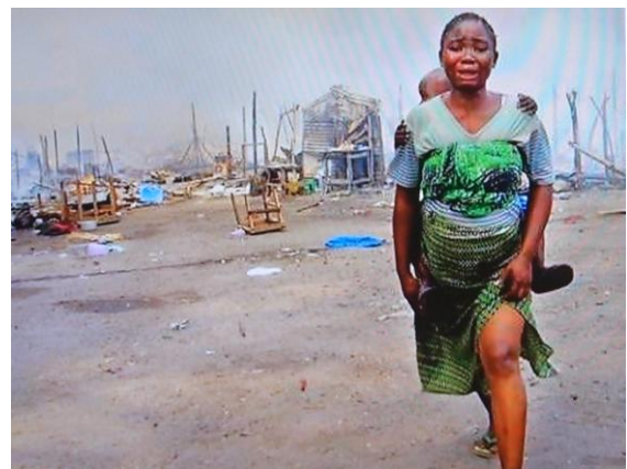
村を焼かれ、子どもを背負って逃げる女性

このコルタンが新たなところで見つかる、開発のためには、そこに住む農民を移動させないといけなくなります。日本では、たとえば新幹線を作るときには、何十年もかけて、そこに住んでいた人々を納得させて土地を買ったりするということになりませんが、向こうではそうしません。いろいろな会社が、無理にでもそこにいる人々を移動させるということになります。つまり、そこで紛争が起きて人が殺されればパニックの状態でみんなが逃げるわけです。