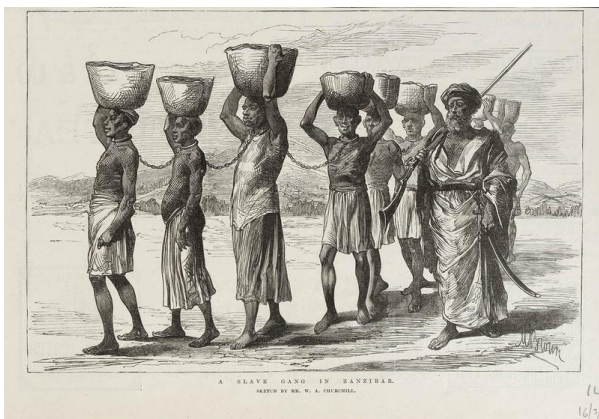
鎖で繋がれたアフリカの奴隷の姿

コンゴを訪れていたポルトガル人は、この頃、こういうダイヤモンドとかコルタンなどは全く知りませんでした。しかも奴隷売買もまだ実行されていませんでした。ちょうどコンゴ側が海に面していたところに入ってきて、ああ、こんな大きい国があると。そしてコンゴの森林がアマゾンとほぼ同じ森なので、びっくりして、いろいろな人を派遣して、いい関係を結んだわけです。そしてお互いにいろいろなものを交換したり、コンゴにあるものをポルトガル人にあげたり、そして宣教師もこの頃にコンゴに入ってきました。アフリカの最初の司教はコンゴ人でした。その頃、今のコンゴとアンゴラと隣のコンゴ共和国とザンビアはほぼ同じ王国に属していました。