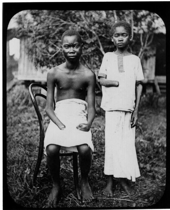
植民地時代に右手を切断された子どもたち

しかし、昔は私たちアフリカでは本当に戦うというよりも何らかの形で平和共存できる形を作っていたのです。言葉が豊かでたくさんの言葉を持っている。日本では日本語だけですけれども、うちのコンゴではびっくりするほど 400 言語もあります。でも、人々がお互いに理解し合うという言葉を決めていて、その 400 から 4 つの大きな言葉で会話できる。南から北へ行くときには、北の言葉もしゃべれるようにというシステムができていました。ヨーロッパではそういうことはわからずにアフリカを分割してしまったのです。